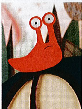
► Des films courts à savourer.

S'il y a bien un film qui s'inscrit dans l'actualité, c'est celui-là ! Au moment où les débats sur ce que peut être une « famille normale » font rage, Mon tonton, ce tatoueur tatoué rappelle une vérité fondamentale : en matière de famille, la normalité est un leurre. La petite Maj caresse encore ce fantasme, sevrée par ce qu'elle voit à la télé, mais vivant en réalité avec un oncle motard et tatoué. Lequel va emmener la pitchoune sur les routes à la recherche d'un modèle familial un peu plus conventionnel que le leur... pour tomber sur bien pire, tel ce magicien dont le papa a malencontreusement été croqué par un gentil tigre ! Le propos anticonformiste de l'ensemble n'interdit pas la tendresse, élément idéal pour l'ouverture d'esprit, l'humour, lui, servant à tordre les idées reçues. ► Mon tonton, ce tatoueur tatoué. A partir de 5 ans. De Karla von Bengtson. Sortie le 17 octobre.