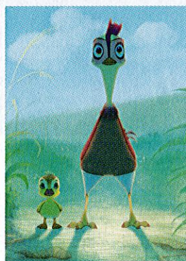
► Lili, la poule téméraire.

A partir de 5 ans. De John Halas et Joy Batchelor. Sortie le 24 octobre.