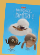
AFFICHETTES (40 x 60 cm)