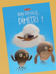
AFFICHES AU FORMAT CINÉMA (120 x 160 cm)